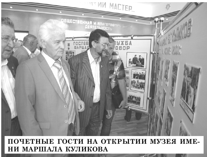
ПОЧЕТНЫЕ ГОСТИ НА ОТКРЫТИИ МУЗЕЯ ИМЕНИ МАРШАЛА КУЛИКОВА