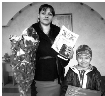
Фото и текст Оксаны ГАМОВОЙ

Пусть радость и счастье царствуют в нём!